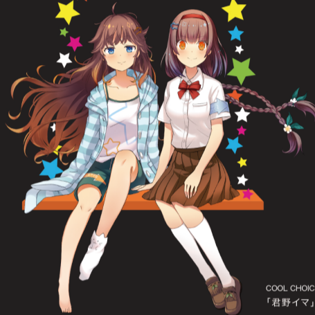
COOL CHOICE イメージキャラクター 「君野イマ」「君野ミライ」

明かりを消して地球温暖化について考える、 ライトダウンキャンペーンが今年もはじまります。