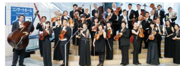
オーケストラ・アンサンブル金沢

当社はヴァイオリンの名器「ストラディヴァリウス“ラング”(1714年製作)」を保有し、これをオーケストラ・アンサンブル金沢へ貸与しています。オーケストラ・アンサンブル金沢は1988年11月、わが国初の本格的なプロ室内管弦楽団として、石川県と金沢市が中心となり設立されました。この素晴らしいオーケストラの支援を通してクラシック音楽の発展に貢献していきます。