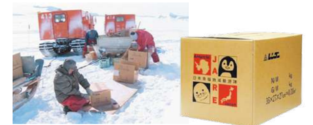
南極地域観測隊に提供している段ボール

国立極地研究所の依頼を受け、南極地域観測隊に第1次(1956年)より連続して段ボールを提供し、観測隊による調査・研究を支援しています。2020年9月には第62次南極地域観測隊へ段ボールを提供しました。南極での活動に欠かせない大切な資材や生活用品の輸送、貴重な収集物を保護するための包装材料として、当社の段ボールが活躍しています。