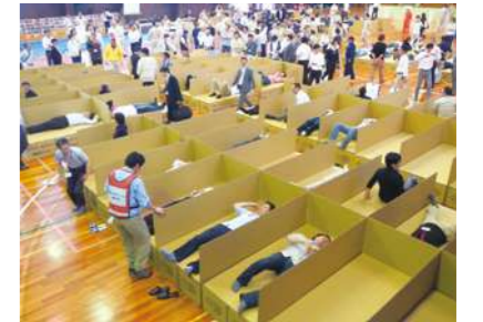
防災総合訓練の様子

地震や台風などの自然災害発生時、避難所の床敷き用段ボールシートやパーティション、段ボールベッド、緊急支援物資輸送用の段ボールケースなどを緊急支援物資として提供しています。特に、段ボールベッドは避難所生活が長引く中、腰痛の軽減やエコノミークラス症候群の予防に役立つと注目を集めています。全国の事業所・工場では、地元自治体である市町村や都道府県と災害時物資供給協定を結び、万一の災害に備えた防災対策を支援しています。当社グループ全体では全国300以上の自治体と個別の防災協定を結んでいます。