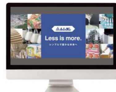
エコプロ Onlineのレンゴー見出し画像

そのほか、環境省が主催する「エコライフ・フェア2020 Online」に初出展しました。エコライフ・フェアは環境問題について学ぶ場を提供する展示会で、段ボールのリサイクル率の高さや意外と知られていない優れた特徴の数々、生分解性素材といった当社の先進的な製品について分かりやすく展示し、さまざまな年齢層の方々へ発信することができました。