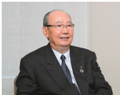
代表取締役会長兼社長