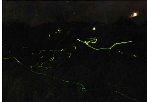
ホタルの飛翔(ビオトープ内)