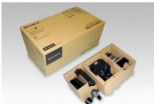
『Corrugated cushioning for video camera』